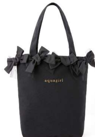
特別付録 リボン付きトートバッグ 異素材のチュールを重ねたリボンモチーフに、ゴールドのロゴが光る上品なデザイン。(高さ31×幅35×マチ10cm)

書籍名: aquagirl ～2012 Spring & Summer Collection～