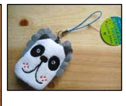
お値段もお手ごろでお土産にも最適！左から、パンダの編みぐるみストラップ(¥300)、ミラー(¥1,000) キーカバー(¥480)、携帯クリーナー(¥550) ※価格は全て本体価格