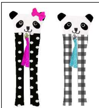
オリジナルのパンダポーチ(¥1,400)は 歯ブラシ入れや筆箱にも