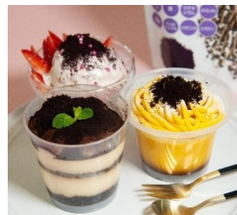
スイーツにちょい足し！