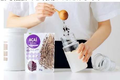
プロテインシェイクにプラス