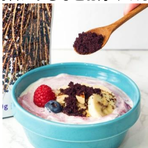
ヨーグルトにトッピング

ヨーグルトのトッピングや、スムージーやプロテインなどのドリンクに加えたり、お菓子や料理の材料にするなどお好みの方法で幅広くご利用いただけます。