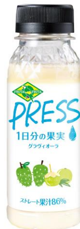
FRUTAFRUTA PRESS グラヴィオーラ

ピンクグアバの芳醇な香りにベリーの甘酸っぱさをプラス。豆乳でまろやかに仕上げました。