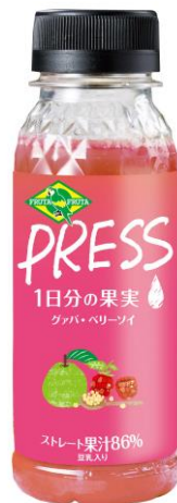
FRUTAFRUTA PRESS グアバ・ベリー ソイ

ピンクグアバの芳醇な香りにベリーの甘酸っぱさをプラス。豆乳でまろやかに仕上げました。