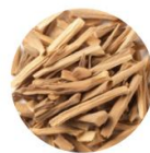
グリチルリチン酸 2K (整肌成分)