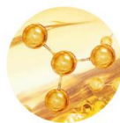
ビタミン B6 *9 (整肌成分) 皮脂吸収パウダー *5