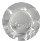
ヒアルロン酸 Na ポリグルタミン酸 Na (保湿成分)

実際に使用いただいた97%の方は「べたつかない」と回答、さらに98%の方は「友人にすすめたい!」と回答しました *6 。