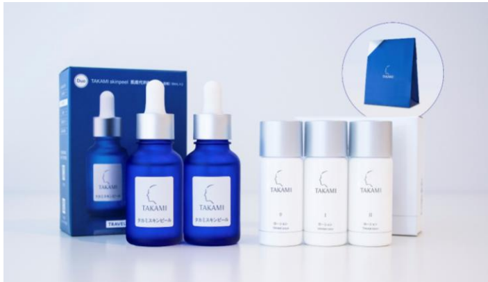
免税店限定のセット

東京・表参道にある美容皮膚の現場で長年にわたりスキンケアの開発に携わってきた化粧品ブランド『タカミ』(本社：東京都中央区、代表取締役：岡村雄嗣、www.takami-labo.com)は、成田空港第1ターミナル南ウイング内免税店「ANA DUTY FREE SHOP」に2019年8月7日(水)～11月上旬(予定)までの期間限定で免税ショップをオープンいたします。