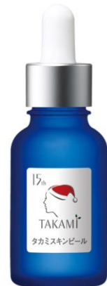
クリスマス限定ボトル