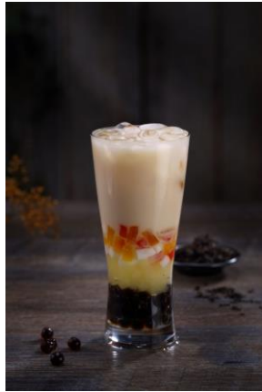
THE ALLEY 三食感ミルクティー

THE ALLEY こだわりの 4 種の茶葉。上質な香りと味わい。それぞれの茶葉で感じる、幸せな時間と生活を。ディリオカ (THE ALLEY 特製 “鹿のタピオカ”) 入りも選べます。