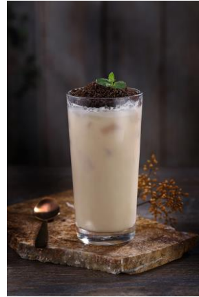
盆栽ミルクティー