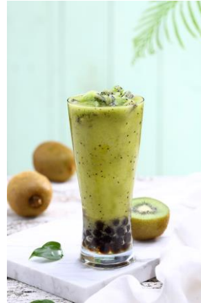
香りと恋するキウイ