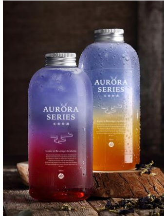
オーロラドリンクシリーズ オーロラ / 日の出

THE ALLEY のドリンクはただの飲み物ではなく、それぞれの商品に、一つの物語（ストーリー）があります。