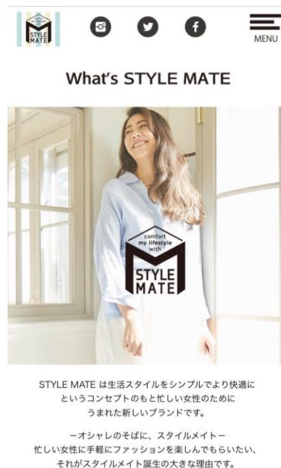
ブランドサイトトップページ

STYLE MATE は生活スタイルをシンプルでより快適に というコンセプトのもと忙しい女性のために うまれた新しいブランドです。 —オシャレのそばに、スタイルメイト— 忙しい女性に手軽にファッションを楽しんでもらいたい、 それがスタイルメイト誕生の大きな理由です。