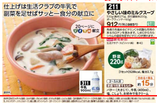
▶原材料、原産地、アレルギーなど見える化しているので安心！