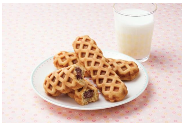
<お召し上がりイメージ>

ふんわりチョコドッグは、ホットケーキミックスとマーガリンを使用して作った生地には、棒状のチョコレートを入れてふんわり焼き上げ完成させました。生地には国産の小麦粉を使用し、食品添加物である乳化剤や香料は使用せず、お子様から大人の方まで安心してお召し上がり頂けます。