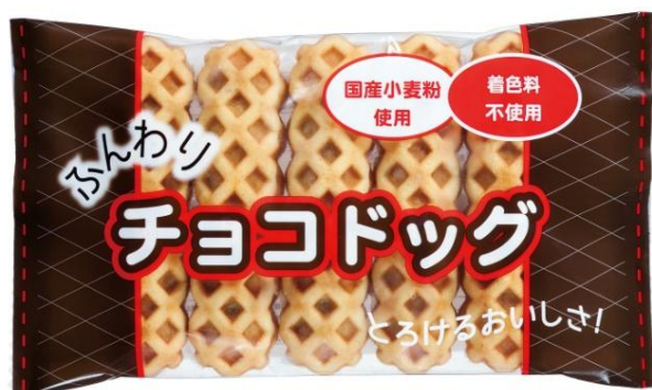
<ふんわりチョコドッグ>

生活クラブ生協連合会(本社:東京都新宿区、以下生活クラブ)は、2018年4月より「ふんわりチョコドッグ」の共同購入を開始いたします。