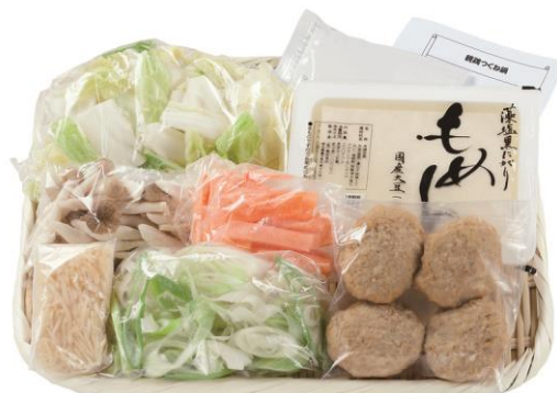
＜中身イメージ例: バイオサポ 親鶏つくね鍋＞

「バイオサポ食材セット」は、10分から15分ほどの調理時間で2~3人分のメインディッシュが作れる、カットされた食材&調味料&レシピが一式揃った状態で届くミールキットです。生活クラブだからこそ、①野菜が多め、②国産素材が中心、③化学調味料不使用(生活クラブのオリジナル調味料使用)の3点にポイントを置いた安心メニューが短時間で仕上がります。