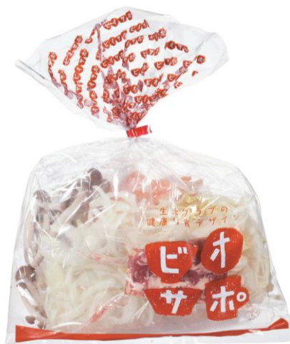
＜バイオサポセット 包材イメージ例＞

生活クラブ生協連合会(本社:東京都新宿区、以下生活クラブ)が提供する、2~3人分の主菜が作れる食材と調味料、レシピがセットになった「バイオサポ食材セット」は、12月で3周年を迎えます。今年の春には包材のリニューアルも実施。皆様からのご意見にお応えし、新メニューの開発を続々と行ない、より多くのニーズにお応えしてまいります。