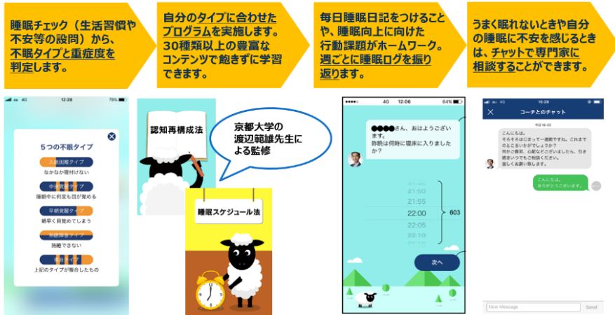
「アドバンテッジ スリープ」概要