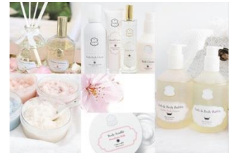
お買い物が便利に！ アプリ限定コンテンツ配信中

また、商品のおすすめ情報や壁紙コンテンツ等のアプリ限定コンテンツもご用意し、お客様との楽しいコミュニケーションのきっかけとなるような様々な企画が今後も展開される予定です。