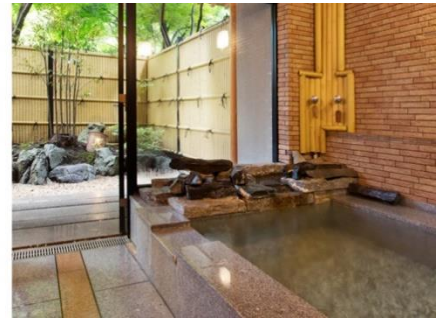
「友琴 (ゆうきん)」石造り