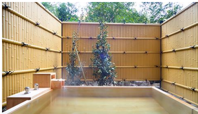
一笑(いっしょう・檜造り)

趣の異なる檜・岩・石造り(バリアフリー)3種の貸切風呂は、ご滞在中1回50分無料でご利用いただけます。バスタオルやアメニティ類も完備し、源泉より引くまろやかな湯をプライベートでお楽しみください。