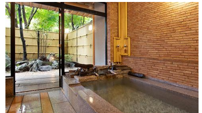
友琴(ゆうきん・石造り)