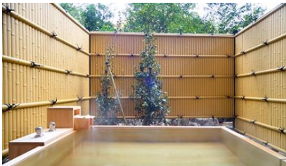
一笑(いっしょう・檜造り)

趣の異なる檜・岩・石造り(バリアフリー)3種の貸切風呂は、ご滞在中1回50分無料。バスタオルやアメニティ類を完備、源泉より引くまろやかな湯をプライベート感覚でお愉しみください。