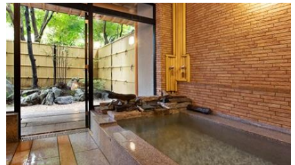
友琴(ゆうきん・石造り)