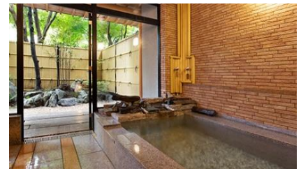
一笑(いっしょう・檜造り)