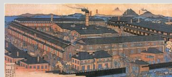
世界文化遺産「富岡製糸場」

■「片倉工業と富岡製糸場が歩んだ歴史」 http://www.katakura.co.jp/tomioka.htm