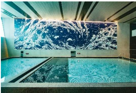
葛飾北斎をモチーフにしたアートが印象的な男湯

江戸文化と海を感じるアートホテルで、日本の夏ならではの湯上がりタイムを提案いたします。