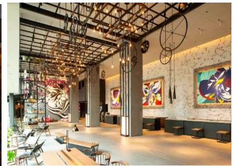
江戸文化を感じるアートが溢れる館内