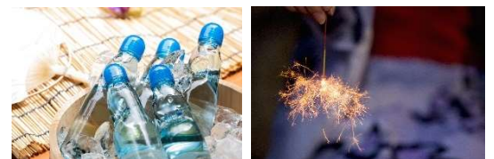
夏庭での夕涼み体験 イメージ

◎本件に関する報道各位からのお問合せ 東京ベイ潮見プリンスホテル 事業戦略 TEL:03-6666-5360 FAX:03-6666-5323