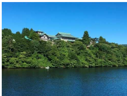
龍宮殿本館 外観(イメージ)