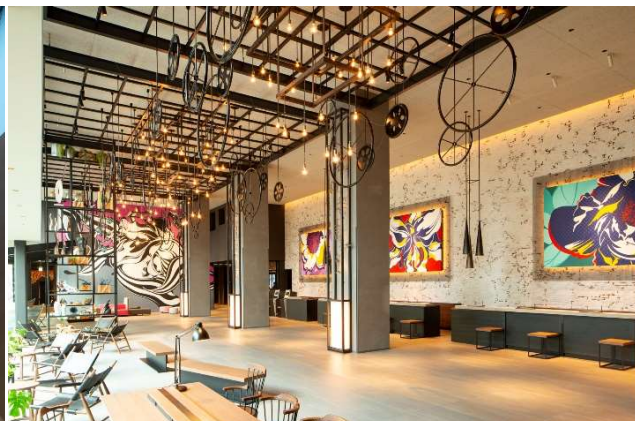
デザインコンセプト「水辺の宿場町」を象徴するロビー