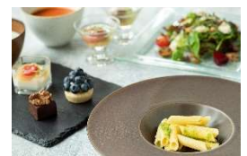
VEGANメニュー イメージ

※ドリンクは約20種類をフリーフローでお楽しみいただけます。アルコールは自治体の要請に従い、当面の間ノンアルコールでの提供となります。