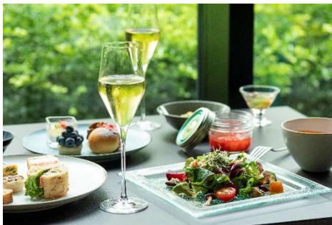
豊かな緑に癒やされる食空間