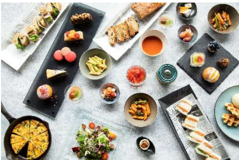
アフタヌーンブッフェ「BE NATURAL」イメージ

生活スタイルの多様化により健康や美容への意識が高まる中、注目の集まる“ヴィーガン”コーナーを設けたブッフェをご用意しました。100%植物性のメニューは、シュガーフリーで自然の甘味を生かしたスイーツ、シェフがオープンキッチンで仕上げるパスタやサラダ等、動物性食品不使用でヘルシーな心も体も喜ぶラインナップ。人気のマリトッツォ等、ヴィーガン以外のスイーツ・フードメニューも揃えておりますので、お好みや体調にあわせながらヴィーガンを取り入れたり、ヴィーガンに興味のない方も一緒にお楽しみいただくことが可能です。感染予防に配慮し、トングを使用しない個々盛りのブッフェで、安心してお召しあがりいただけます。「食べ過ぎてしまった1週間の終わりに」「食欲の秋のリセットに」、豊かな緑とアートに癒される空間で体をととのえる週末をご提案します。