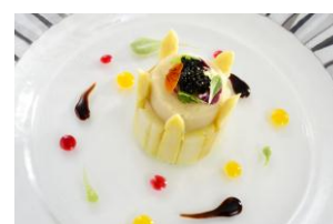
ホワイトアスパラガスのシャルロット グリンピースのフォンダンと毛蟹のジュレ