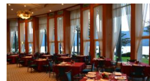
ル・トリアノン 店内