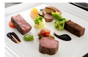
箱根西麓牛背肉のパヴェ仕立て シャラン産鴨のエギュイエット フォアグラ添え エピス風味

■開業 40 周年記念 ガラディナー クラシック&モダンの饗宴 伊藤俊幸×下井和彦コラボレーションフェア