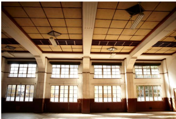
元講堂は朝食レストランへ

ザ・ホテル青龍 京都清水は昭和 8 年に建てられた元清水小学校を保存・活用して建てられました。「記憶を刻み、未来へつなぐ」をコンセプトに長年地域で愛されてきた学び舎の歴史を刻み込みながら大切に受け継ぎ、未来へとつないでまいります。世界遺産清水寺の参道に面した唯一無二の立地を活かし、この場所でしか見ることができない「絶景」とこのホテルでしかできない「体験」を組み合わせ、お客さまの「記憶に残る旅の喜び」を提供いたします。