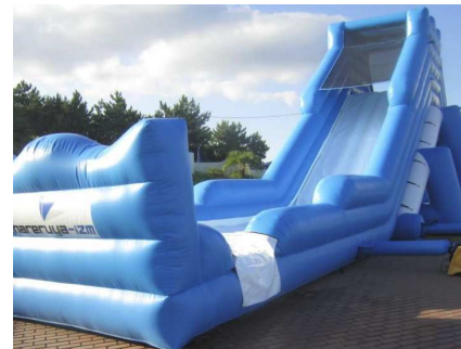
ウォータースライダー