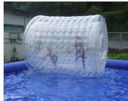
ウォーターホイール