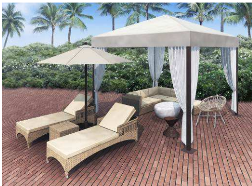
プレミアムカバナ

※ホテルゲストエリアの設置に伴い、日帰りのお客さまは「こどもプール」および「シンクロ&競泳プール」は ご利用いただけません。あらかじめご了承ください。