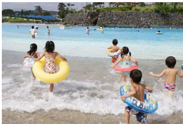
波のプールに駆け込む子どもたち