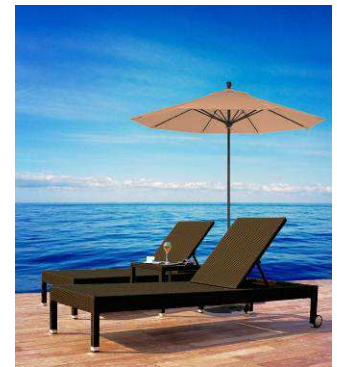
プレミアムデイベッド S