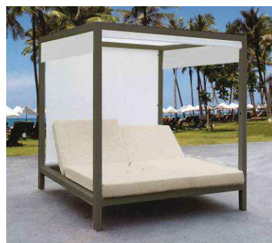
サンラウンジャー 「キューブ」