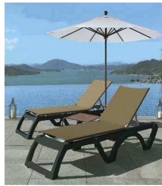
プレミアムデイベッド K