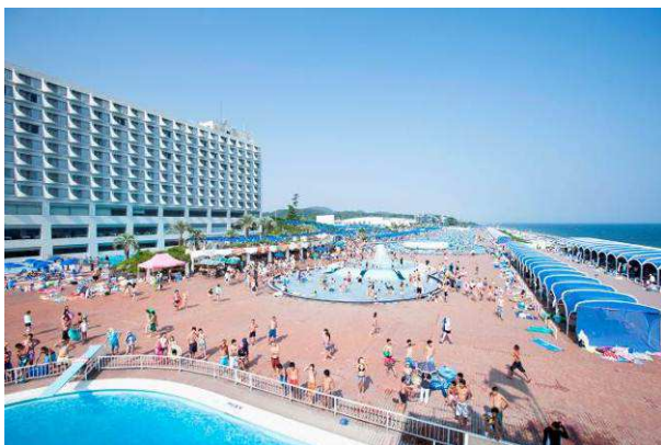
大磯ロングビーチ 全景

大磯ロングビーチは東京から車で約45分、電車でも約1時間と都心からほど近い湘南のシーサイドリゾートです。相模湾を目の前に望みながら、全長140mのウォータースライダーや、波のプール、最高10mのダイビングプールなど、バリエーション豊かなプールがお楽しみいただけます。