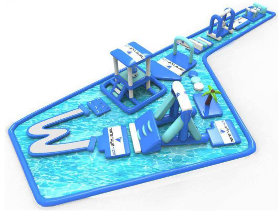
インフレーターブル ウォーターパーク

また、そのほかに水上をお散歩できる 「バブルボール」や「ウォーターホイール」 「ふわふわウォータースライダー」、 「ドクターフィッシュ」もあり、おとなから お子さままでお楽しみいただけます。