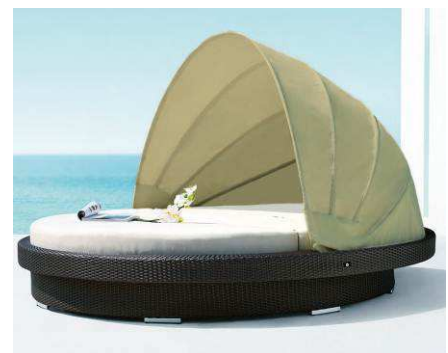
サンラウンジャー 「シェル」