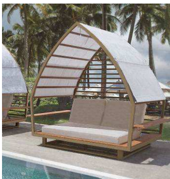
サンラウンジャー 「トライアングル」