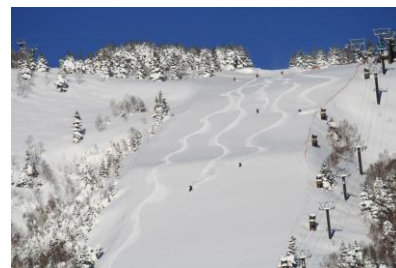
【オリンピックコース】

料金:無料(大浴場のご利用は西館のご宿泊者のみ、平日に限り東・南館のご宿泊者もご利用いただけます)