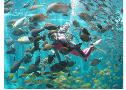
箱根園水族館 大水槽