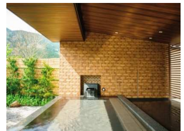
箱根仙石原プリンスホテル (姥子温泉)