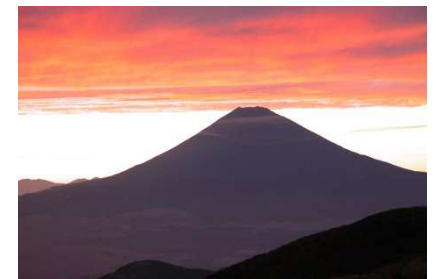
山頂からの富士山