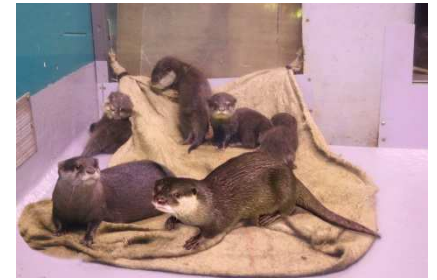
コツメカワウソ イメージ