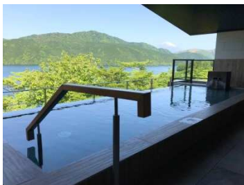
絶景日帰り温泉 龍宮殿本館 (蝸川温泉)

泉質:カルシウム ナトリウム 硫酸塩泉 塩化物泉 効能:神経痛 筋肉痛 関節痛他