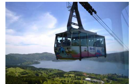
箱根 駒ヶ岳ロープウェー