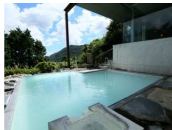
箱根湯の花プリンスホテル (湯の花沢温泉)