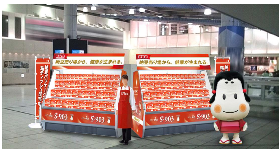
各イベント会場イメージ