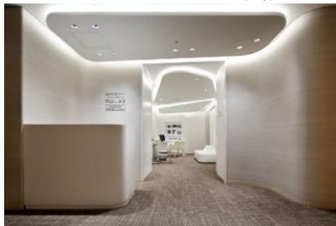
健康増進カウンセリングルーム

早坂信哉 東京都市大学人間科学部教授監修による「温泉利用型健康増進プログラム」。ダイエットメニュー、慢性腰痛改善、メタボリックシンドローム改善、便秘改善、温泉と蒸気を使った美容法、免疫力向上、高血圧改善、膝痛改善の8種をご用意しております。最新鋭の体成分分析装置「In-Body」を取り揃えたカウンセリングサロンで、専門のスタッフが温泉利用と合わせた健康増進プログラムをご提案いたします。