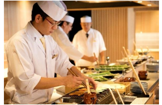
御食事処 ライブ割烹 万蓮

ご夕食は、料理人のダイナミックかつ繊細な腕前を、目で舌でお楽しみいただけるライブ割烹ディナーbuffeをご用意しております。鮭、天婦羅、ローストビーフのほか、旬を味わう季節の一品料理やこだわりのスイーツを心ゆくまでお楽しみいただけます。