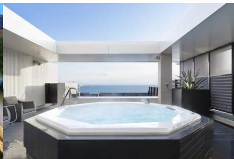
宿泊者限定 展望大浴場