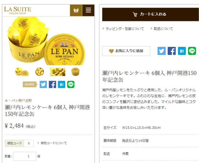
スマートフォンサイト 商品詳細ページ