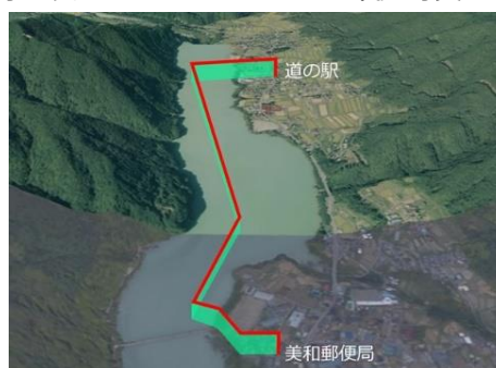
配達飛行経路(美和郵便局～道の駅)