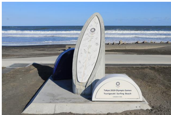
一宮町 釣ヶ崎海岸サーフィンビーチ

一宮町では、大規模地震に備え、津波災害への防災対策を整備していますが、現状の防災無線だけでは、海岸線延長約 7.5km の沿岸地域に対して十分な避難指示・誘導を行うことが難しい状況です。また、一宮町は全国有数のサーフィンスポットであり、東京 2020 オリンピックの正式競技会場にも選ばれており、海上にいるサーファーへの迅速な情報伝達が求められています。