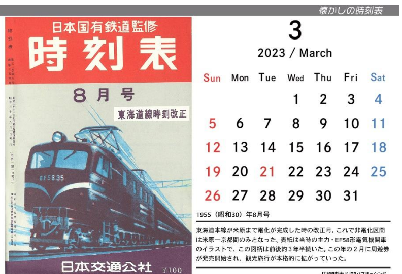
2023年単月カレンダー（解説付き）