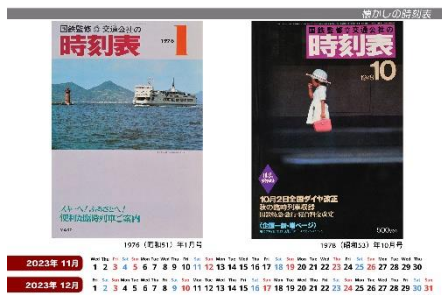
2023年2ヵ月カレンダー