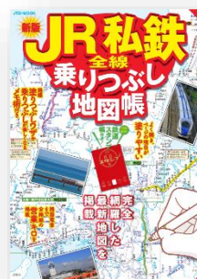
▲JR私鉄全線乗りつぶし地図帳