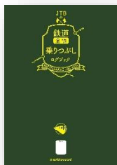
▲JTBの鉄道全線乗りつぶしログブック