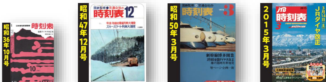
▲デジタル復刻した過去の時刻表、各号の表紙

北陸新幹線が金沢まで延伸された時の改正号、「かがやき」や「はくたか」が新たに主役となった号。