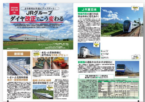
▲巻頭カラーページ内容

本誌の巻頭カラーページでは、いよいよ開業する北陸新幹線、金沢－敦賀間の情報や、新幹線をはじめとする目的地へのアクセスや利便性の向上など、JR 各社のダイヤ改正によって人々の日常生活にどのような変化があるのか。さらに新型車両の情報なども掲載している。新年度から知っておきたい全国の改正情報を図解も交えて掘り下げている。