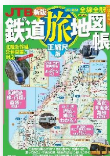
▲JTBの鉄道旅地図帳 正縮尺版