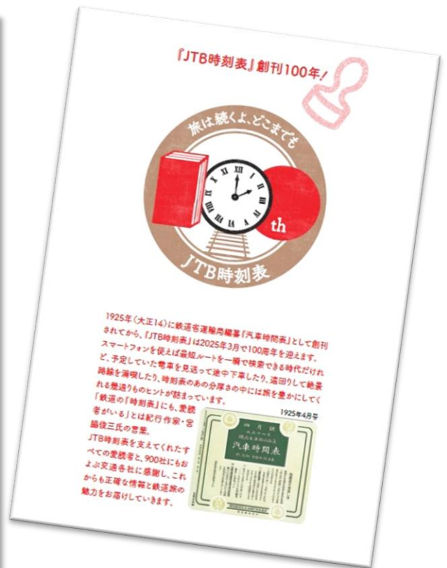
Design & Illustration by Eiji Mitooka + Don Design Associates