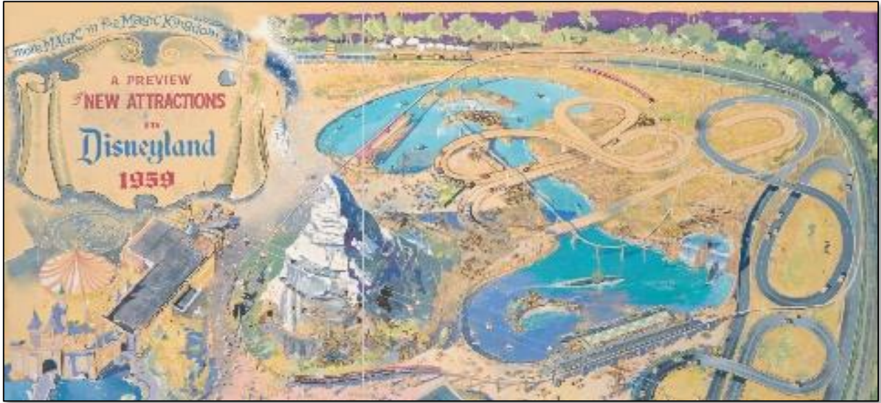
1958年にハーブ・ライマンが作成した「1959年ディズニーランドの新しいアトラクションのプレビュー」