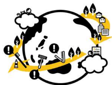
WeBase 高松 “環境に優しいホテル” シンボルマーク

WeBase 高松ではこれまで、瀬戸内の事業者として瀬戸内海の海洋ゴミ問題を考える活動に参画し、食べ残し削減に向けた呼びかけや啓発活動を行い、食品ロスを減らすことが目的の「かがわ食品ロス削減協力店」として香川県から認定され、環境問題への取り組みに積極的に行って参りました。