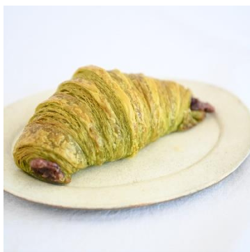
クロワッサン 抹茶 ¥497（税込）

リベルテを代表するクロワッサンなど5種のクロワッサンシリーズを販売致します。新発売の「クロワッサン 抹茶」は、京都の爽やかな春をイメージし、創業140年以上続く宇治抹茶専門店「小澤清風園」の宇治抹茶と、京都で古くから製餡所を営む都製餡の希少価値の高いシュマリ小豆のこし餡を使用。程良い渋味と旨味が広がる抹茶と豆の旨味と上品な甘さ感じるこし餡、バターの風味が口の中に広がります。その他、プレーン、フランボワーズ、マンゴーパッション、ショコラのクロワッサンもお楽しみいただけます。そして焼菓子には、ラム酒とバニラビーンズの芳醇な香りと大振りながら味わい深いカヌレやお手土産にぴったりな焼菓子の詰め合わせをご用意いたしました。さらにクロワッサンや焼菓子のお供にぴったりなコーヒー・紅茶などのソフトドリンクも提供いたします。