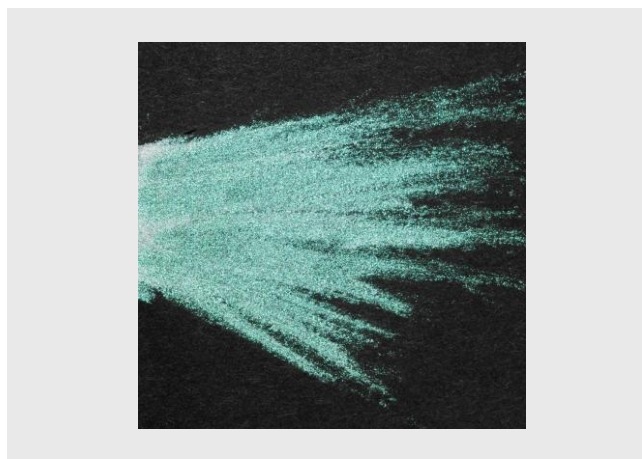
＜グリーンパール＞赤みやニキビ跡を補整して目立たなくする