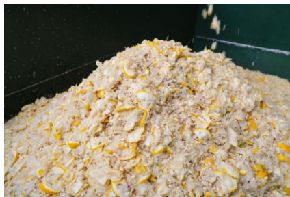
収穫されたゆずの搾汁の様子