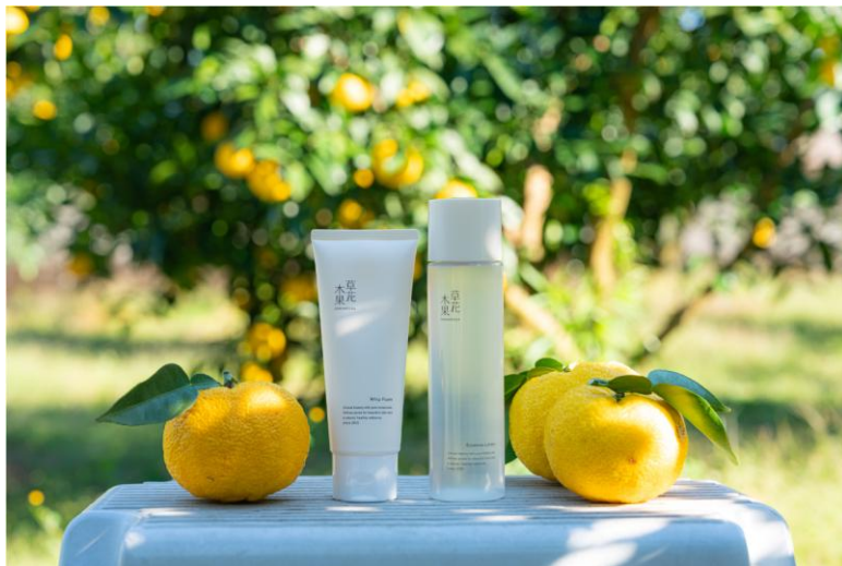
左：草花木果 ホイップフォーム 右：草花木果 エッセンスローション

これからも、植物の力を活かした価値ある製品づくりを通じて、自然と人がともに美しくあり続ける未来を目指してまいります。