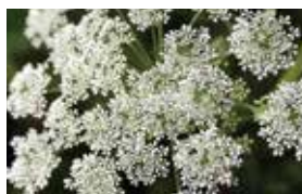
当帰 [とうき] 美白(メラノソーム分解)、抗シワ、血行促進

伊吹山など、本州中・北部の山地に自生もしくは薬用として栽培されている多年草。セロリに似た香りが特徴で、夏に多数の白い花をつける。「当に帰る」という意味を持ち、病弱な女性がこれを服用すると元気になった、などいわれがある。肌に対しては、エラスターゼ阻害(タルミ・シワ抑制)、保湿、血行促進によるくすみ改善が期待される。