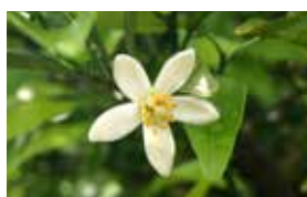
陳皮 [ちんぴ] 抗炎症

民間薬として ▶ 肝臓の痛み、頭痛、アレルギー症状の改善、安眠・リラックス効果があるとされている。