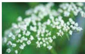
川芎 [せんきゅう] 血行促進、抗老化、抗菌

北海道や岩手県など東北地方で栽培されている多年草。薬用として根茎を用いる。血行促進効果や抗老化、抗菌作用が期待される。