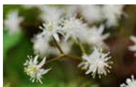
黄連 [おうれん] メラニン生成抑制

きんぼうげ科オウレン属の日本特産の常緑多年草。日本各地に自生し、薬用の目的で栽培されている。幕末の頃より栽培が始まったといわれ、根を折ると断面が濃黄色のため黄連の名がある。肌に対しては、美白(チロシナーゼ活性阻害)、抗酸化作用、抗老化作用が期待される。