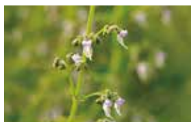
延命草 [えんめいそう] 抗炎症、抗酸化

民間薬として ▶ 血液を補い、血液循環をよくする作用があることから、冷え症などの婦人科疾患の改善に用いられる。