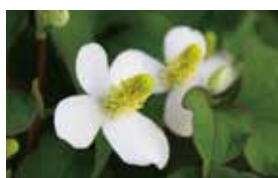
どくだみ 肌あれ改善

ドクダミ科ドクダミ属ドクダミを指す。日本では本州、四国、九州、沖縄に広く分布。薬用として開花期の地上部を用いる。