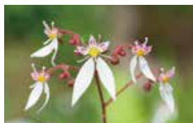
雪の下 [ゆきのした] メラニン生成抑制

可憐な白い花を咲かせる、日本国内で収穫できる植物にこだわり、古くから日本人が民間薬として用いてきた「美肌へ導く」といわれている8種の植物を厳選。8種の植物が合わさることで肌に働きかけ、生まれながらに備わった肌本来の美しさを引き出します。まるで、白い花のように透明感に満ちた、キメ細かく明るい素肌へ。