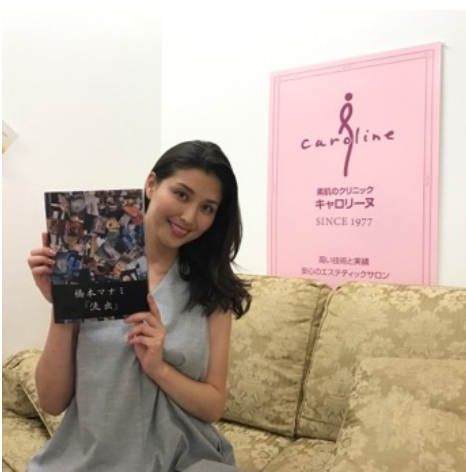
3月に発売された写真集「流出」と一緒に

いつもやっていただくのは、 がんがんかいそく 『眼元快足（足裏マッサージ）』です。マッサージ中から内臓が動き始めるのが分かり、むくみが取れるだけでなく、お通じも良くなります。私は疲れやストレスが溜まると、肩甲骨の辺りが凝って息苦しくなってしまうのですが、 かいぜん 『リンパ快源』をやっていただくと肩甲骨周りが軽くなって良く眠れます。フェイシャルでのお気に入りメニューは、 けいろくびがん 『経絡美眼』。目は疲れるとたるみやすくなりますよね。目立つ場所ですし、やはり一番気になります。それが、施術後は眼がぱっちりとして、顔全体が引き上がった感じになるんです。『経絡美眼』には肩と頭のマッサージにフェイスパックも付いていて、気になる部分のお手入れが一度に全部できる、満足度が高いメニューです。自宅では、キャロリーヌオリジナル化粧品を使ってお手入れしています。『コントロール クレンジング』を使うようになってから、小鼻の黒ずみがきれいになりました。お肌に元気がないときは、『プレミアムフェイスマスク』を使います。本当にお肌がプルプルになるのでおすすめです！