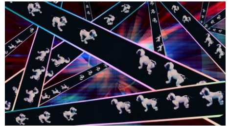
LED ランウェイを闊歩する aibo