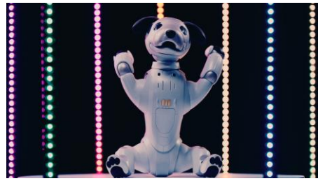
aibo ならではのダンスモーションも披露