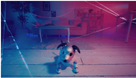
クラブ空間で音に合わせて踊る aibo

白く清潔感のある日常的な部屋の中を歩いている aibo。何かの音をキャッチしたかのように耳がピクッと動き、あたりを見渡すとレーザーライトの光が降り注ぎます。その瞬間、部屋がクラブのような空間に早変わり。aibo サウンドをふんだんに活用した、石野卓球ならではのサウンドにあわせて aibo が踊りだします。自身の鳴き声にあわせてふるまったり、LED ランウェイをカッコよく歩いたり、今までとは異なる aibo の映像をお届けします。アーティストと aibo のコラボレーションによって拡張される、音楽、映像体験をお楽しみください。