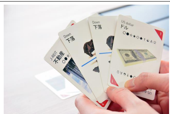
金融教育カードゲーム「Asset Allocation」

金融や投資は、お金の悩みを改善するためのひとつの手段になりますが、「怖い」と感じる方も多いようです。しかし、その理由が、ただ「よく知らないから」というケースも少なくありません。そうした人は、是非、「Asset Allocation（アセット・アロケーション）」で遊んでみて下さい。投資の基本的なルールを学ぶことができます。