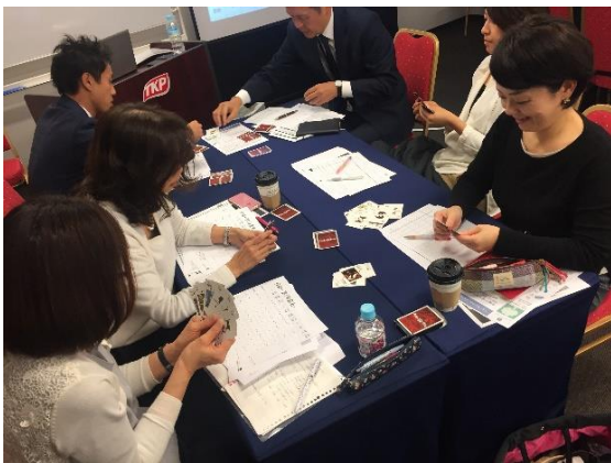
保険会社にて実施したカードゲームを用いたセミナーの様子

※「GM 金融教育アンバサダー」募集ページ URL： https://vesta-education.themedia.jp/posts/3273033