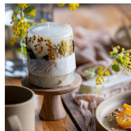
ミモザキャンドル