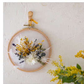
ミモザカレイドフレームの花飾り