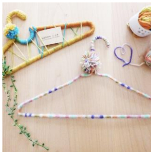
針金ハンガーをリメイク！デコレーションハンガーの作り方