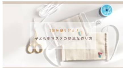
手作りの「子供用マスク」の簡単な作り方

おうちで子供と何しよう？と悩んでいるお父さんお母さんのアイデアのヒントとして、毎日のおうち時間に役立ててください。