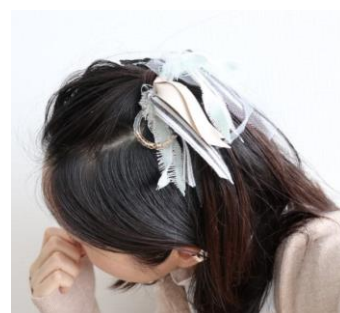
はぎれ布で作れる 『フリンジヘアゴム』のレシピ