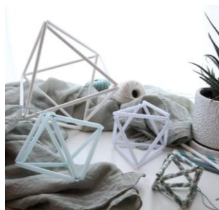
ストローで作るおしゃれインテリア 『北欧風ヒンメリ』のレシピ