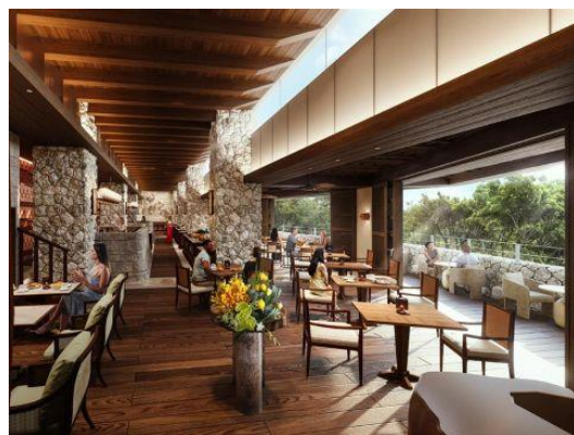
メインダイニング 森 “MUI”