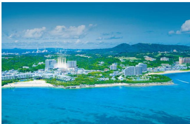
周辺俯瞰図（イメージ）

＜公式ホームページ URL＞ https://www.blisstia-onnason.jp/ ※2 月 6 日（金）12:00 公開予定