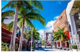
那覇国際通り商店街 約3.1km