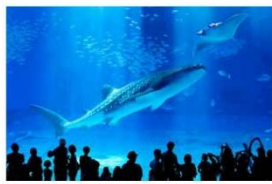
沖縄美ら海水族館 約47.6km