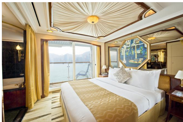
エグゼクティブ スイート 318,000円～ フロア面積：50.15～60.41㎡ 定員：3名 キングサイズベッド/バスタブ付き/バルコニー付き

旅行代金：客室タイプや出港日によって旅行代金は異なります *2名1室利用時の大人1名様割引後の料金となります