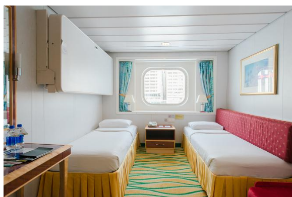
オーシャンビュー ステートルーム(窓付) 158,000円～ フロア面積：13.24～15.56㎡ 定員：3～4名 2シングルベッド+ソファベッド+プルマンベッド クイーンサイズベッド+ソファベッド/ハンドシャワー付き/窓付き