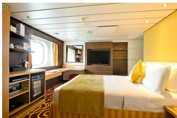
スター スイート 218,000円～ フロア面積：19.85㎡ 定員：3名 クイーンサイズベッド+ソファベッド/ハンドシャワー付き/バルコニーなし