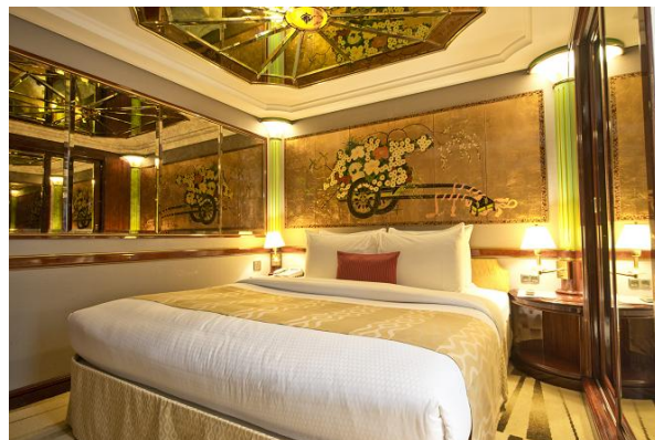
ジュニア スイート 228,000円～ フロア面積：36.77～43.73㎡ 定員：4名 キングサイズベッド+ソファベッド/バスタブ付き/バルコニー付き