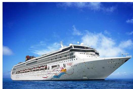
スタークルーズの旗艦船『スーパースター ヴァーゴ』

アジアで歴史を重ねてきたスタークルーズだからこそお届けすることができる船旅では、細部にまで行き届いたアジアンホスピタリティとともに、日常から離れ、まだ見ぬ世界へとお客様をご案内させていただきます。