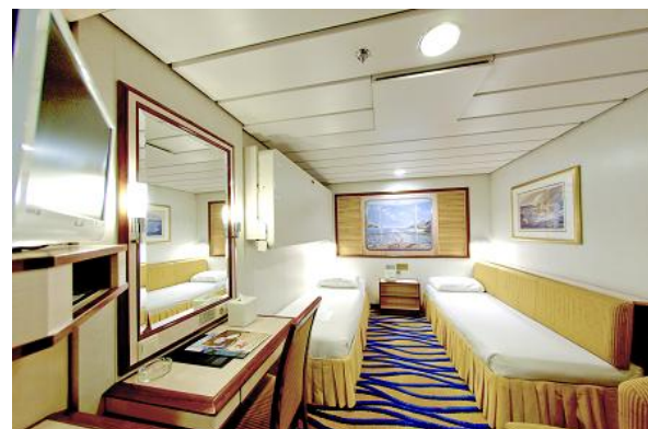
インサイド ステートルーム 128,000円～ フロア面積：12.06～20.55㎡ 定員：3～4名 2シングルベッド+プルマンベッド+スライドベッド クイーンサイズベッド+ソファベッド/ハンドシャワー付き/窓なし

※早期割引プロモーション期間中、上記全ての表示料金から30,000円引きとなります(一部出港日を除く)