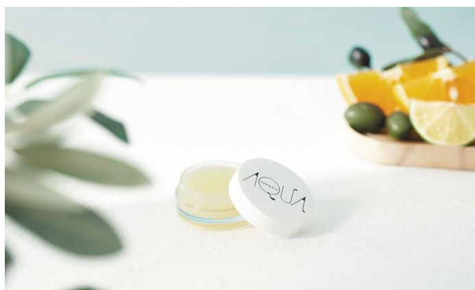
オーガニックフルーティーバーム(シトラス)

「アクア・アクア」では、2019 年秋冬コレクションとして、8 月 29 日（木）にブランド初のスキンケアアイテム「オーガニックフルーティーバーム」と人気のオーガニッククッションコンパクトの新色「ピンクブライト」を販売いたします。